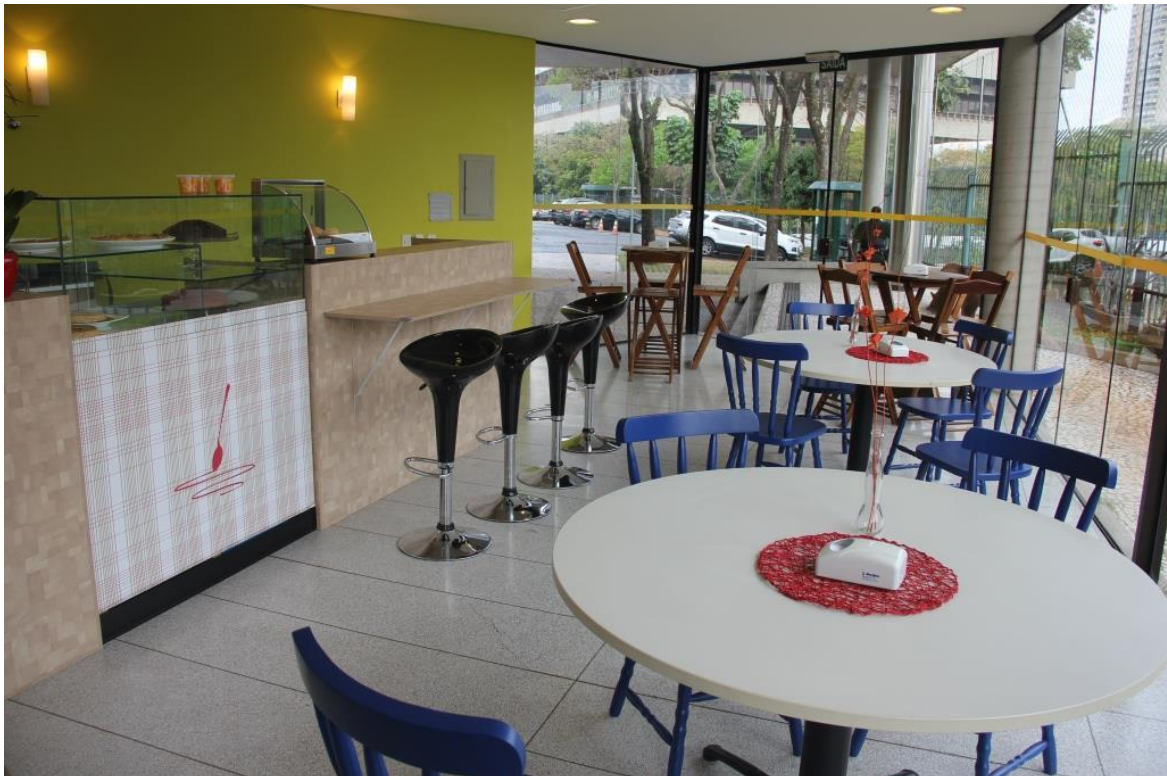
Figura 3: Café Bistrô