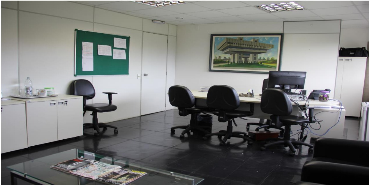
Figura 6: 1º Andar (sala Diretoria)