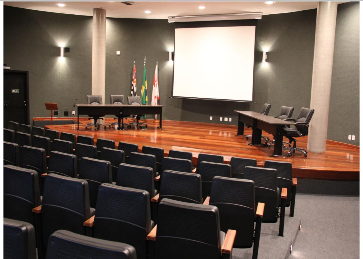
Figura 4: Auditório