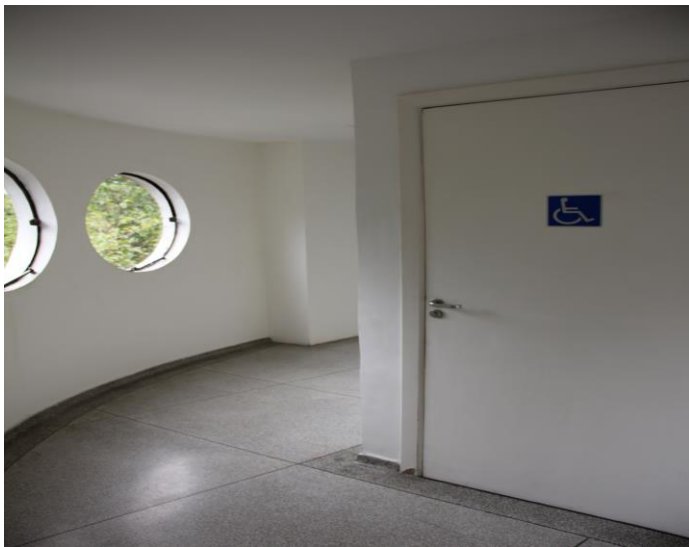
Figura 9: 2º Andar (banheiro)