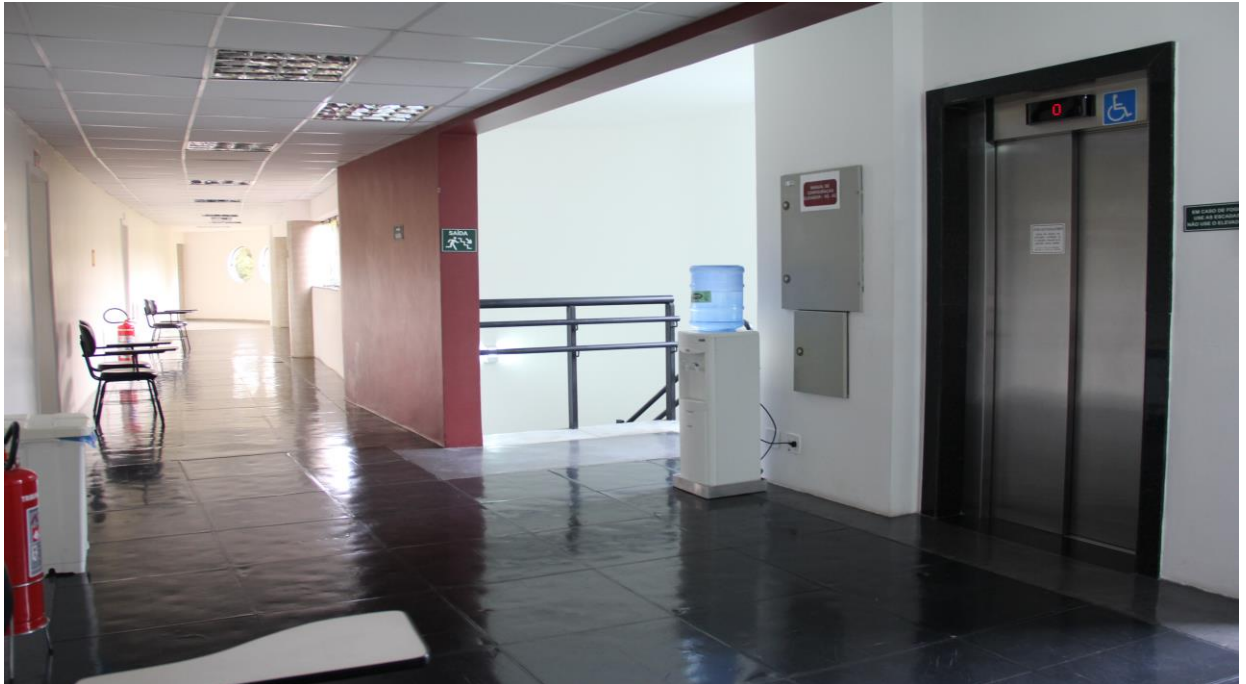
Figura 8: 2º Andar (corredor)