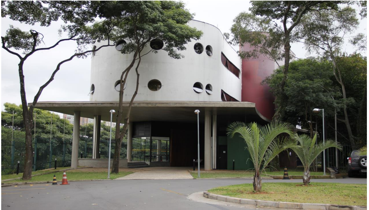
Figura 1: Visão geral do prédio