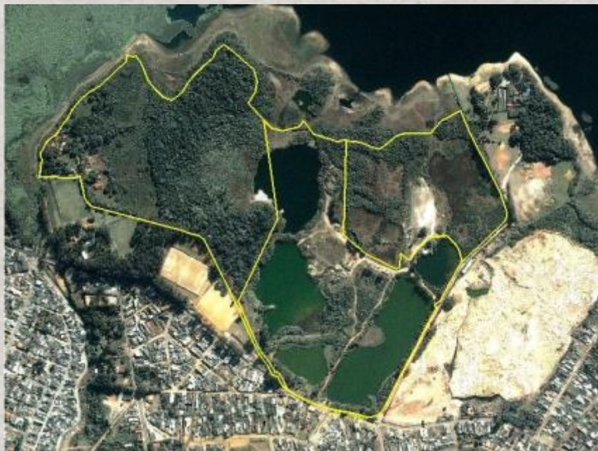
Imagem do terreno com as divisas (2008)