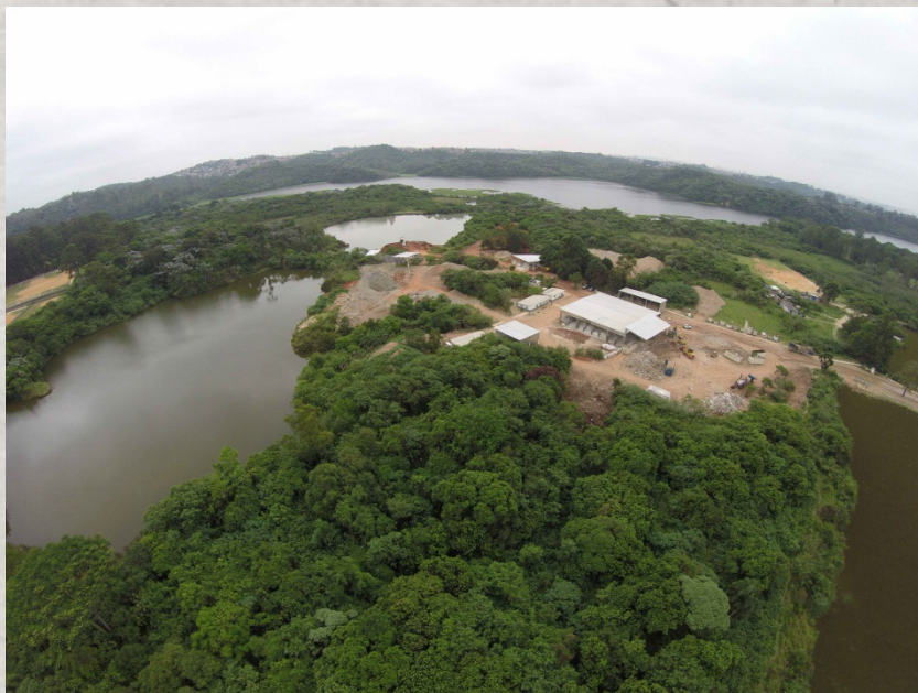
Imagem do terreno ATUAL (OUTUBRO 2015)